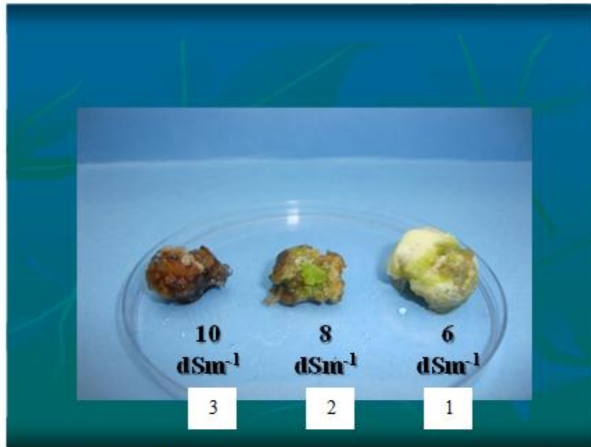
شكل (4) الكالس المستحدث من نيات الفلفل النامي على الأوساط الملحية (1) EC 6 (2) EC 10 (3) EC 8