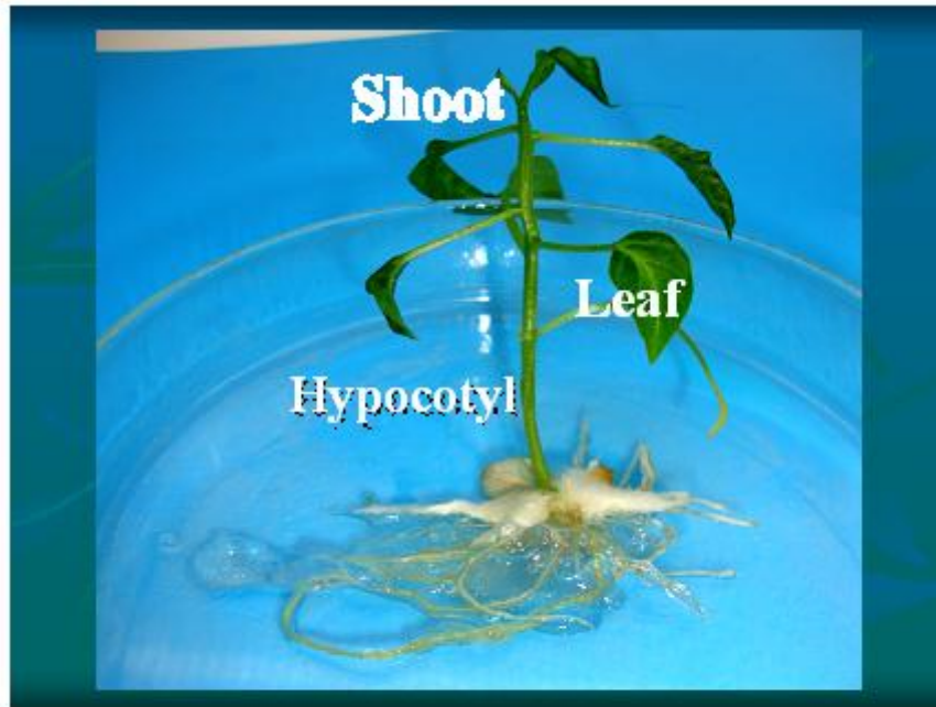
شكل رقم (1): بادرة نبات الفلفل الحلو بعمر 14 يوم