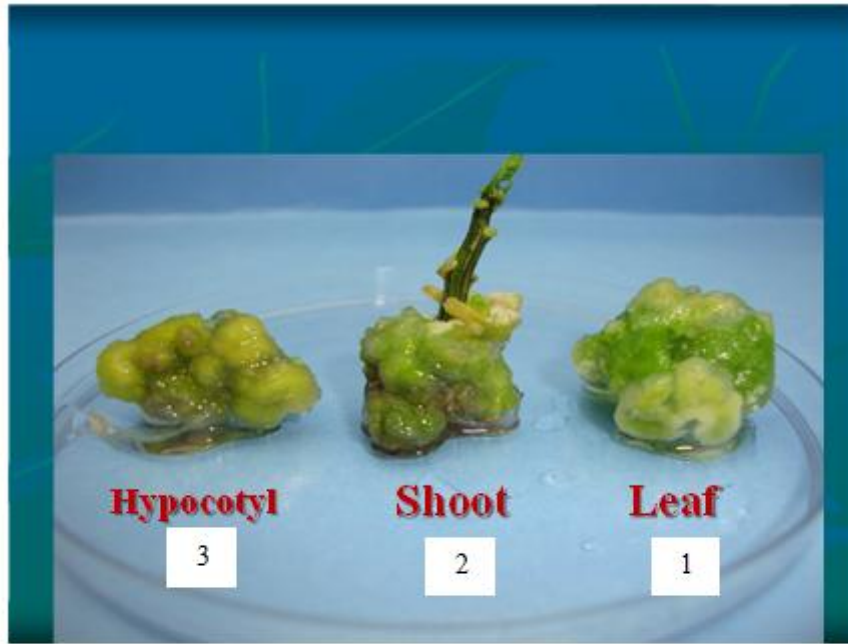
شكل (3) الكالس المستحدث من الأجزاء المختلفة لنبات الفلفل الحلو (1) الأوراق (2) السويقة الجذبية السقلى (3) القمة التامية بعد 40 يوم من الزراعة

جدول ( 3 ) تأثير الملوحة في الوزن الطري والجاف للكالس المستحث من نبات الفلفل الحلو